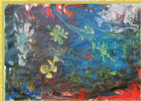
ЭБРУ. БУМАГА. 2017