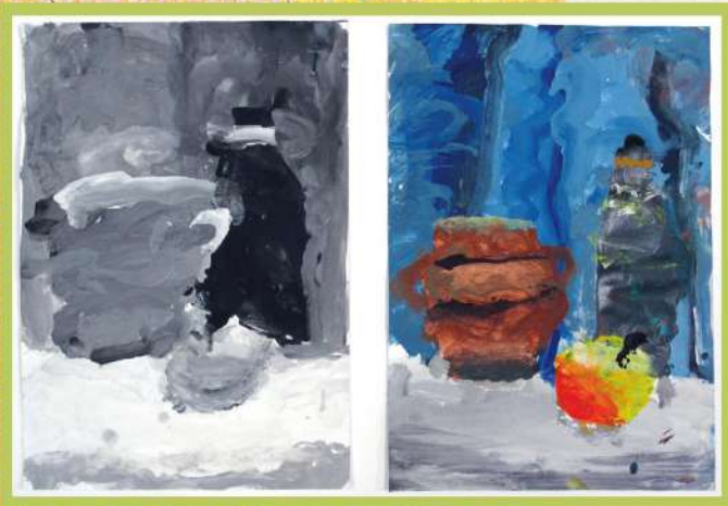
НАТЮРМОРТ. ТОНАЛЬНЫЙ РАЗБОР, ГУАШЬ. 2018