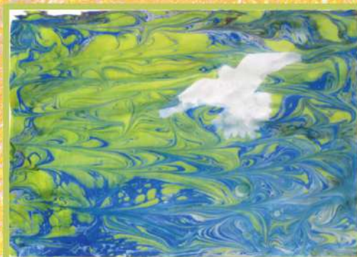
ЭБРУ. БУМАГА. 2017