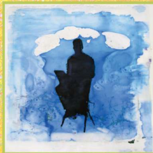
Человек с ноутбуком. Горячий батик, 2018