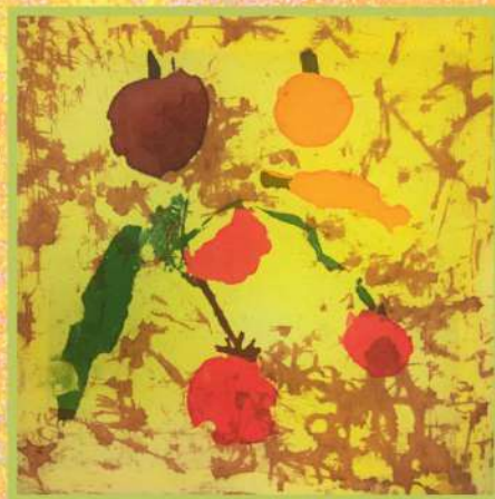
Овощи. Горячий батик, 2017