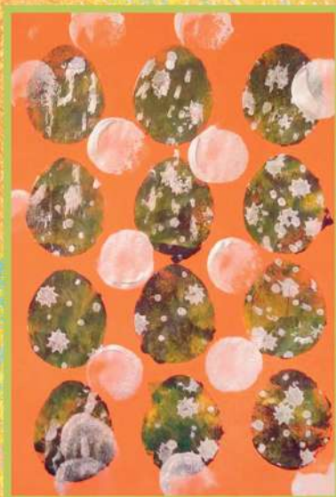
ПАСХАЛЬНЫЙ ПРИНТ. ГУАШЬ, ТРАФАРЕТЫ. 2018

На самом деле, Никита ходил в Эрмитаж, и не один раз. Но эти походы были связаны с занятиями по истории, поэтому, видимо, походом в музей он эти мероприятия не считает.