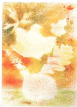
«Букет» Техника «набрызг»