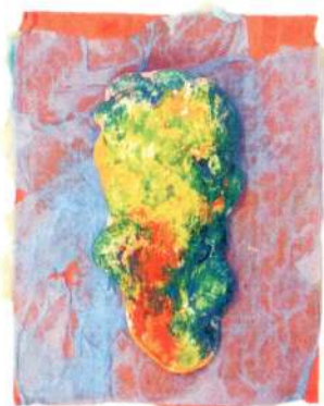
«Лист дуба» (гипс)