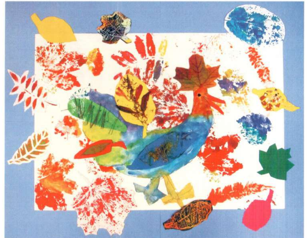
Коллективная работа 5-7-х классов

Мы обратили внимание, с каким удовольствием, с какой ответственностью подошли наши юные художники – оформители к выполнению всех социальных заказов. И, несмотря на то, что самих работ нет на выставке, мы посвятили этим проектам отдельные информационные стенды. А большую часть выставочных работ учеников мастерской составили как раз учебные зарисовки и пейзажи, над которыми каждый автор трудился самостоятельно.