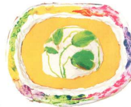
«Анютины глазки» (гипс, рамка папье-маше)