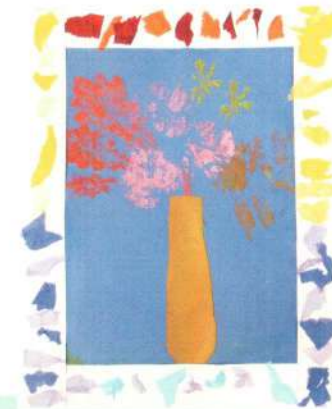
«Букет» (техника «отлип»)