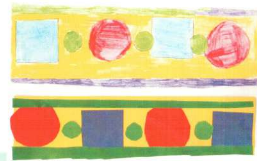
Орнамент (эскиз и выполненная работа)