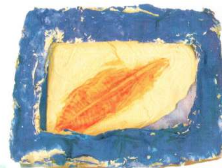
«Лист молочая» (гипс, рамка папье-маше)