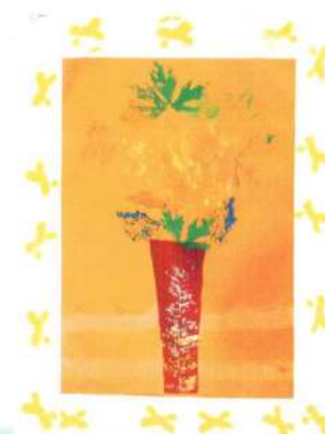
Гаспарян Рузанна 9 «Б»