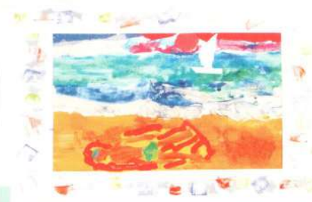
«Максим на пляже»