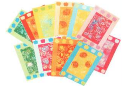
Поздравительные открытки ко дню 8 марта