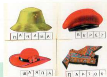
Альбом «Головные уборы»