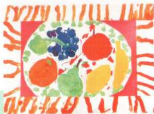
«Тарелка с фруктами»