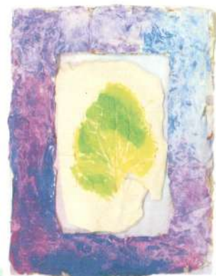
«Лист» (гипс, рамка «папье-маше»)