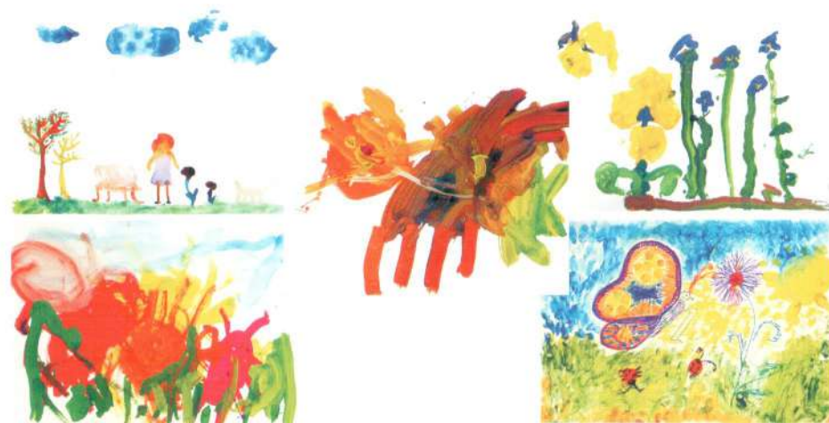
Некоторые листы из «Книги отзывов» шестой ежегодной выставки «Звезда на ладони», 2013 год.

Мы с радостью приветствуем посетителей седьмой ежегодной выставки творческих работ и личных побед детей «Звезда на ладони». Семь лет. С одной стороны, это не очень большой срок. С другой стороны, за семь лет школьники успевают вырасти и стать практически взрослыми. Ощущается «смена поколений», подрастают дошкольники, которые совсем недавно были еще слишком малы, чтобы оценить качество своих работ и получить удовольствие от участия в выставке. И нам, организаторам и педагогам, очень приятно наблюдать все эти изменения. Мы с удовольствием фиксируем и представляем вниманию посетителей выставки все достижения и каждую из личных побед наших детей. Надеемся, наш энтузиазм и радость передадутся всем гостям и участникам выставки. Мы очень рады, что Вы к нам пришли!