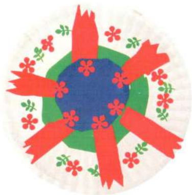
Оформление тарелки (орнамент)