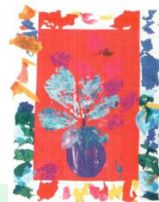
«Букет» (техника «отлип»)