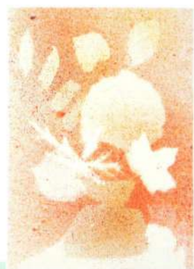
«Букет» Техника «Набрызг»