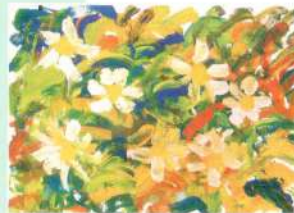
«Поле с ромашками»

Во втором полугодии учебного года ученики мастерских старательно готовили поздравительные открытки ко дню 8 марта для одиноких бабушек, живущих в Доме ветеранов «Красная Звезда» в Зеленогорске.