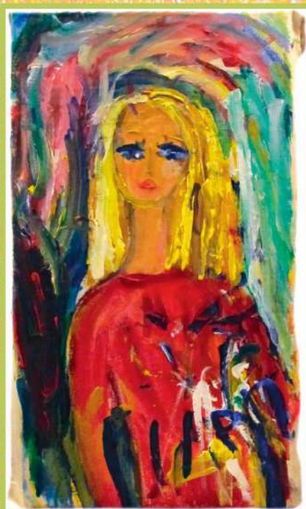
ПОРТРЕТ МАМЫ. АКРИЛ, ХОЛСТ 2014