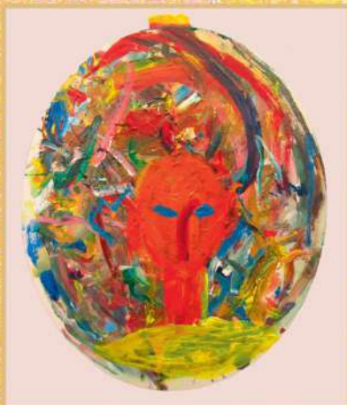
АВТОПОРТРЕТ. АКРИЛ, ХОЛСТ. 2014