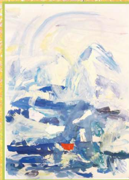
КОРАБЛЬ ВО ЛЬДАХ, ГУАШЬ. 2015

К теме снега и льда Роман неоднократно обращался в своем творчестве. Одна из наиболее ранних работ этой тематики — «Корабль во льдах».