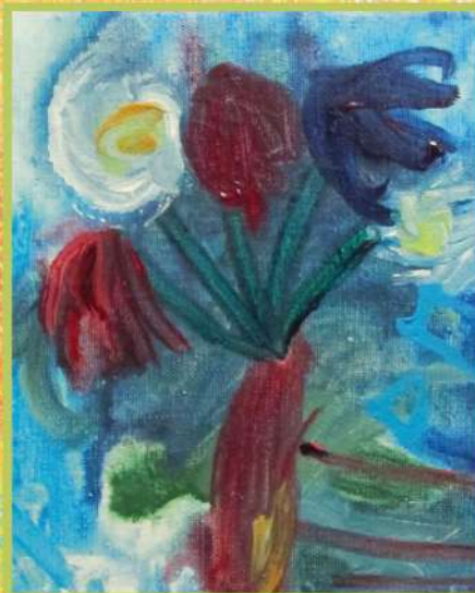
БУКЕТ ДЛЯ МАМЫ. ГУАШЬ. 2010