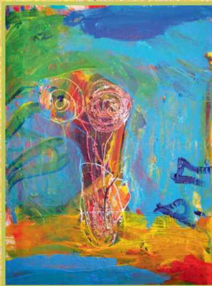
АСТРЫ, АКРИЛ 2015