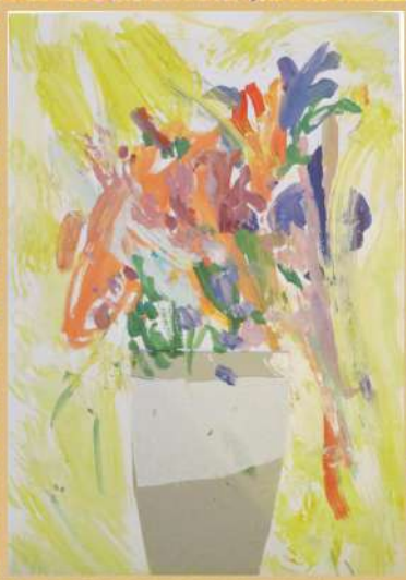
БУКЕТ. АКРИЛ. 2015