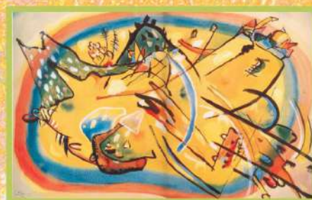
В. Кандинский «Композиция. Пейзаж. 1915»