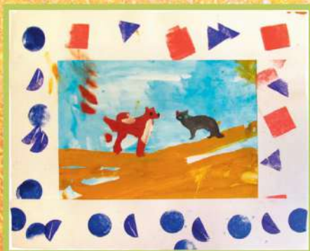
Пес и кот. Гуашь, штампы. 2014