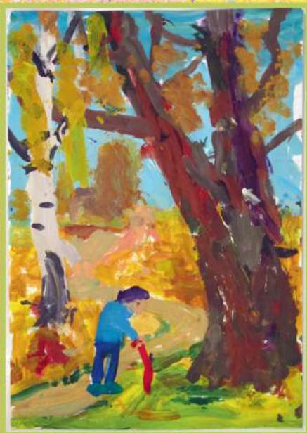
Осень. Парк. Прогулка. Гуашь. 2015

Одна из особенных работ Максима, посвященных осени, выполнена также на индивидуальных занятиях в 2015 году.