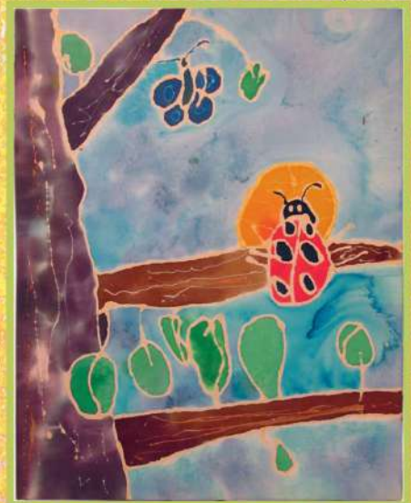
Божья коровка. Холодный батик. 2016

В этом году Максим вернулся к занятиям после годичного перерыва, и сразу с головой окунулся во все знакомые и новые для него техники.