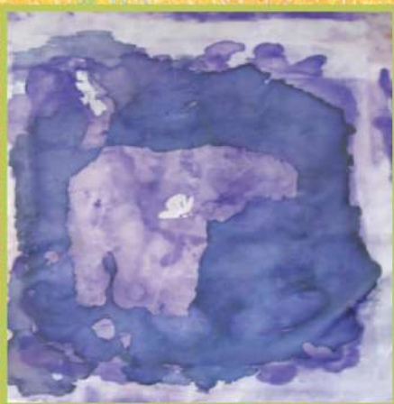
Салон. Горячий батик. 2018

Интересно, что на этой работе Максим изобразил себя, но не сидящим в коляске, а идущим по дорожке парка своими ногами, хотя и с помощью палочки.