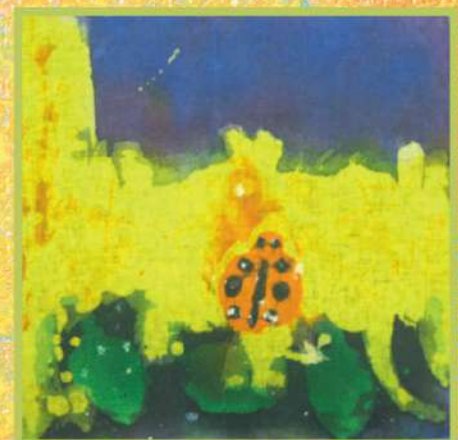
Божья коровка. Горячий батик. 2018