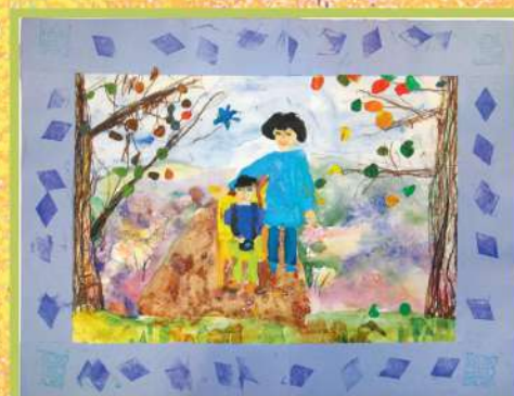
НА ПРОГУЛКЕ. СМЕШАННАЯ ТЕХНИКА. 2014