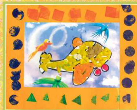
САМОЛЕТ. СМЕШАННАЯ ТЕХНИКА. 2014