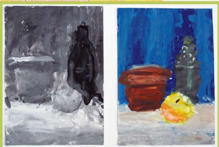
НАТЮРМОРТ. ТОНАЛЬНЫЙ РАЗБОР. Гуашь. 2018

И к заданиям в мастерских Константин тоже относится очень серьезно. Например, упражнение на тональный разбор он выполнял очень сосредоточенно и целеустремленно.