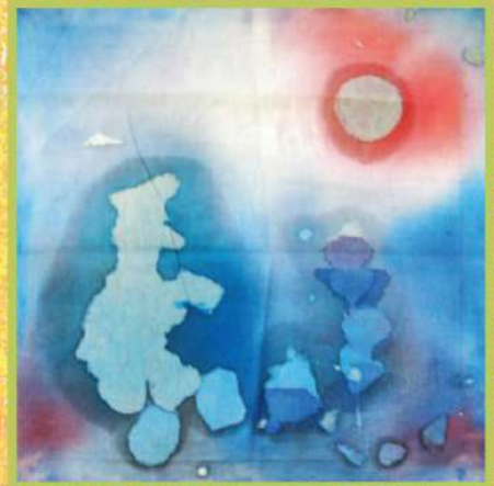
ПОЧТАЛЫОН ПЭТ НЕСЕТ ПИСЬМО СОСЕДУ. БАТИК. 2017

В школе Константин учится старательно, тща-тельно готовится дома к занятиям, некоторые задания