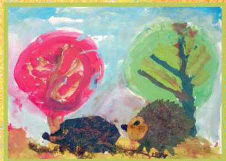
ЁЖИКИ. ГУАШЬ, ФЛОРА. 2015

За время учебы в мастерских Кон-стантин уже целую серию работ про любимых ёжиков создал. И даже книгу про ёжика проиллюстрировал.