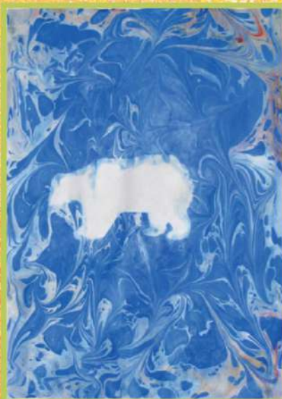
БЕЛЫЙ МЕДВЕДЬ. ЭБРУ. 2017

И к заданиям в мастерских Константин тоже относится очень серьезно. Например, упражнение на тональный разбор он выполнял очень сосредоточенно и целеустремленно.