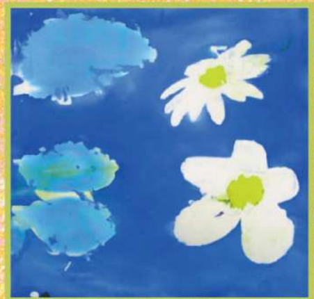
РОМАШКИ. ГОРЯЧИЙ БАТИК, ТКАНЬ. 2018